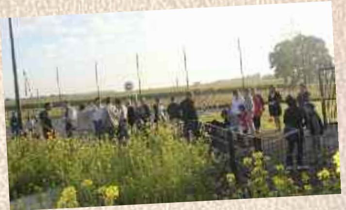
Rentrée des classes Robert Doisneau