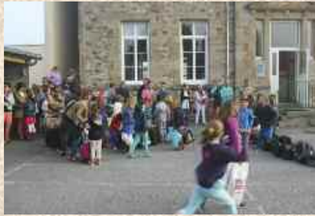
Rentrée des classes Notre-Dame-de-Lourdes