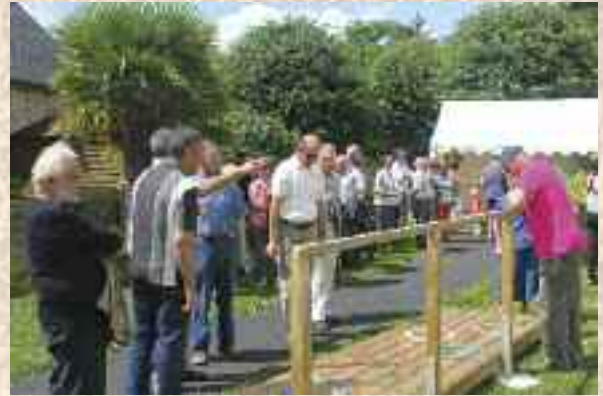
Inauguration maison de retraite