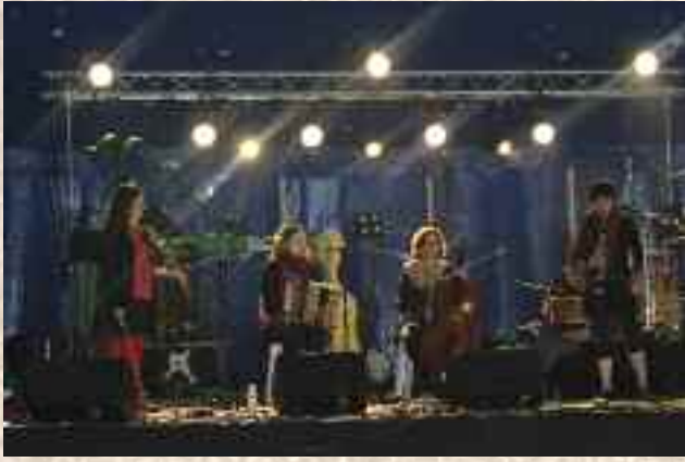
Festival Marche de Bretagne à Etreilles