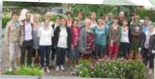
Équipe éducative école

Notre communauté éducative compte aussi les associations de parents (OGEC, APEL, ASSE) et les bénévoles (ateliers, catéchèse, étude, jardin...). Chacun, à sa manière, oeuvre pour voir chaque enfant grandir et s'épanouir.