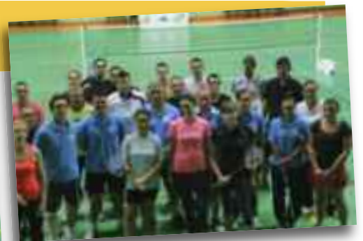
Les groupes à l'entraînement le mercredi soir.

Date à retenir : 22 décembre tournois jeunes