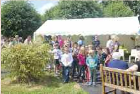
Inauguration parcours santé maison de retraite H. Hévin