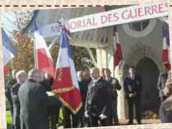
Remise du drapeau aux soldats de France