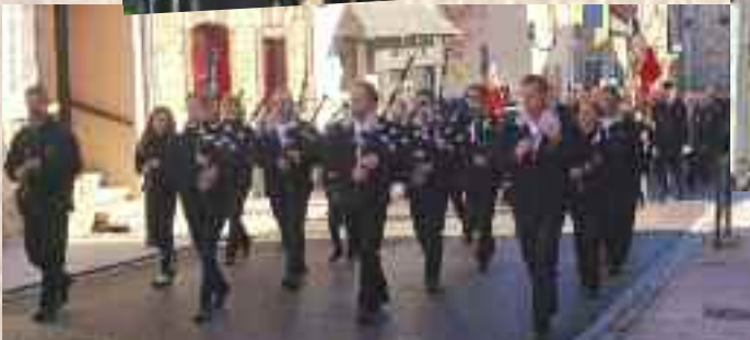
Défilé du 11 Novembre avec le Bagad d'Argentré du Plessis