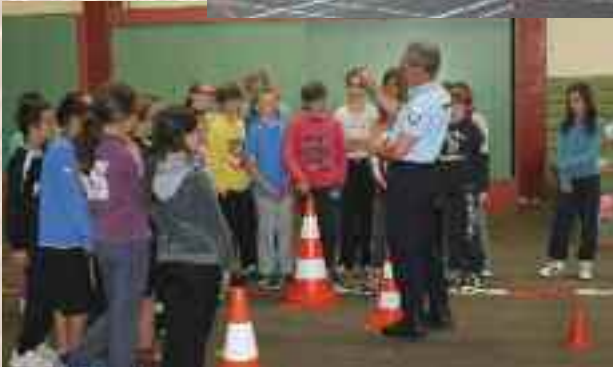
Sécurité routière pour les écoles