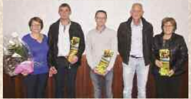
Médaillés du travail