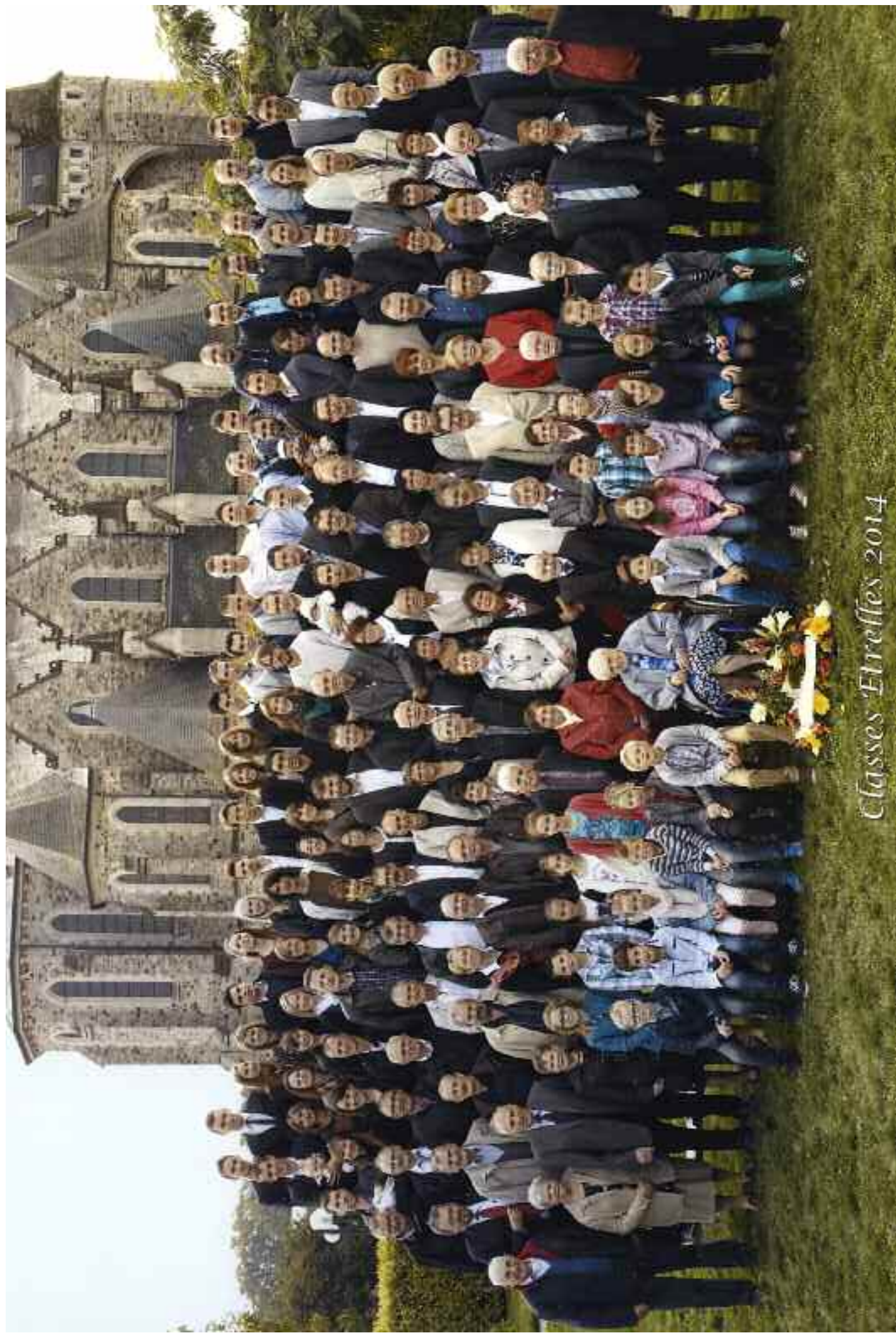
Classes Etrelles 2014