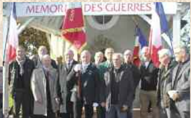
les 13 soldats de France d'Etreilles