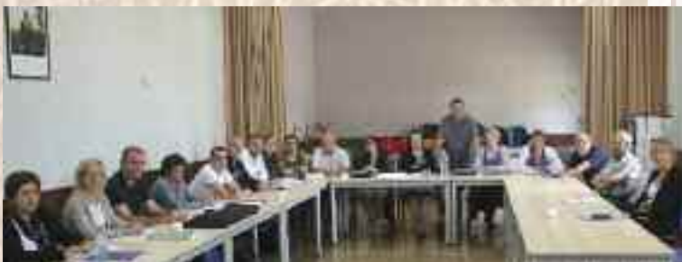
Formation des élus