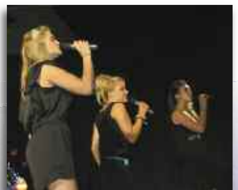
Des jeunes chanteuses Vitréennes étaient sur scène pour la première fois