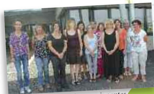
Personnel et enseignantes de l'école Robert Doisneau

Bonne reprise à tous, parents et enfants, Les enseignantes