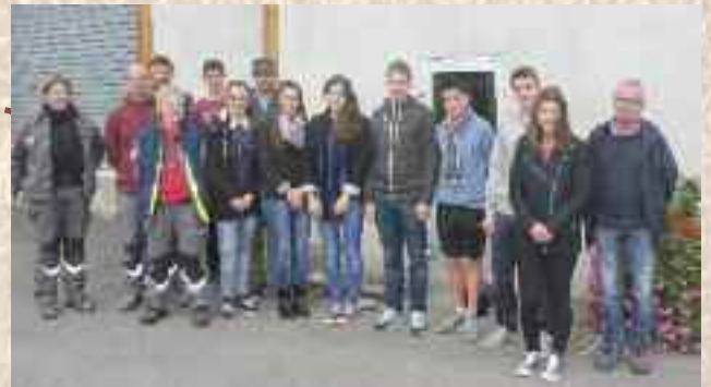
Jeunes dispositif argent de poche