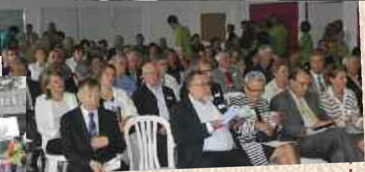
Inauguration pôle enfance