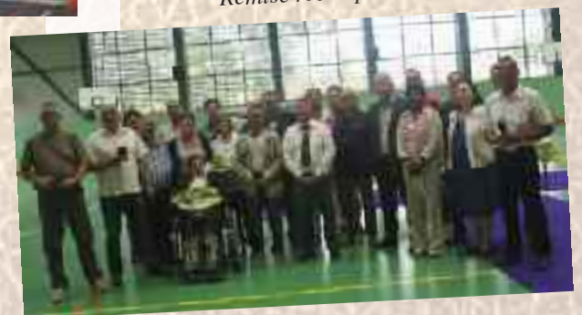
Remise récompense 40 ans du foot