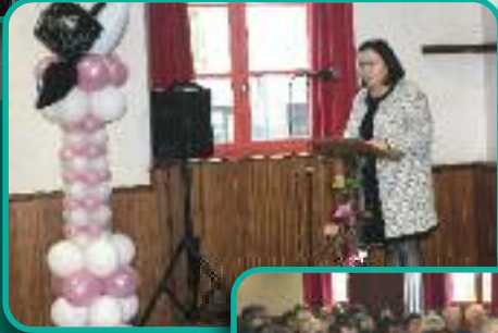
Voeux du maire