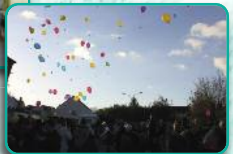
Téléthon lâcher de ballon