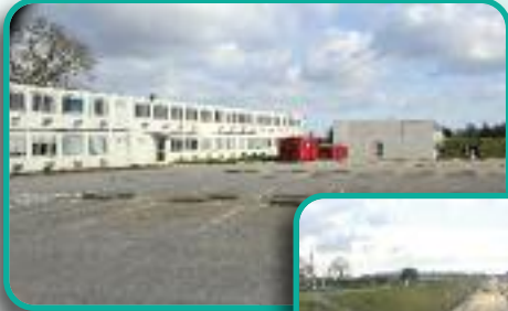
Déménagement de la base LGV