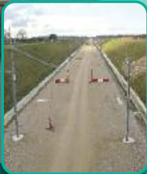
Travaux sur la ligne LGV