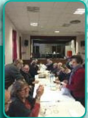
Galette des rois du club de l'amitié