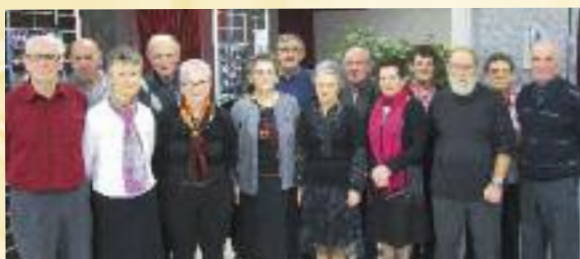
Bureau du club de l'amitié