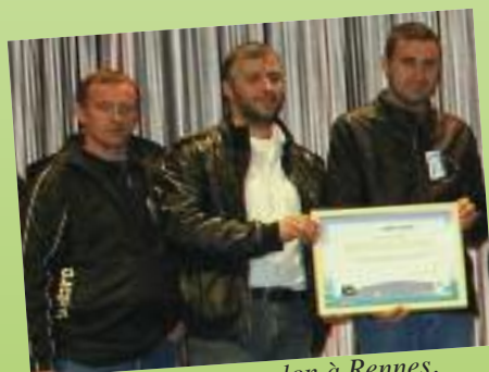
Remise au salon à Rennes.