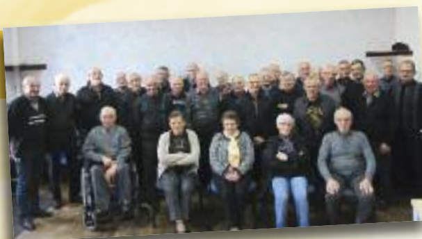
AG des AFN et soldats de France