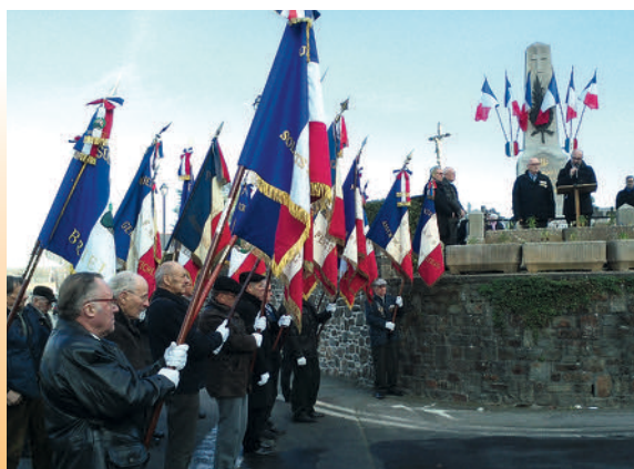
Cérémonie cantonale, hommage aux morts à Argentré-du-Plessis le 5 décembre 2016